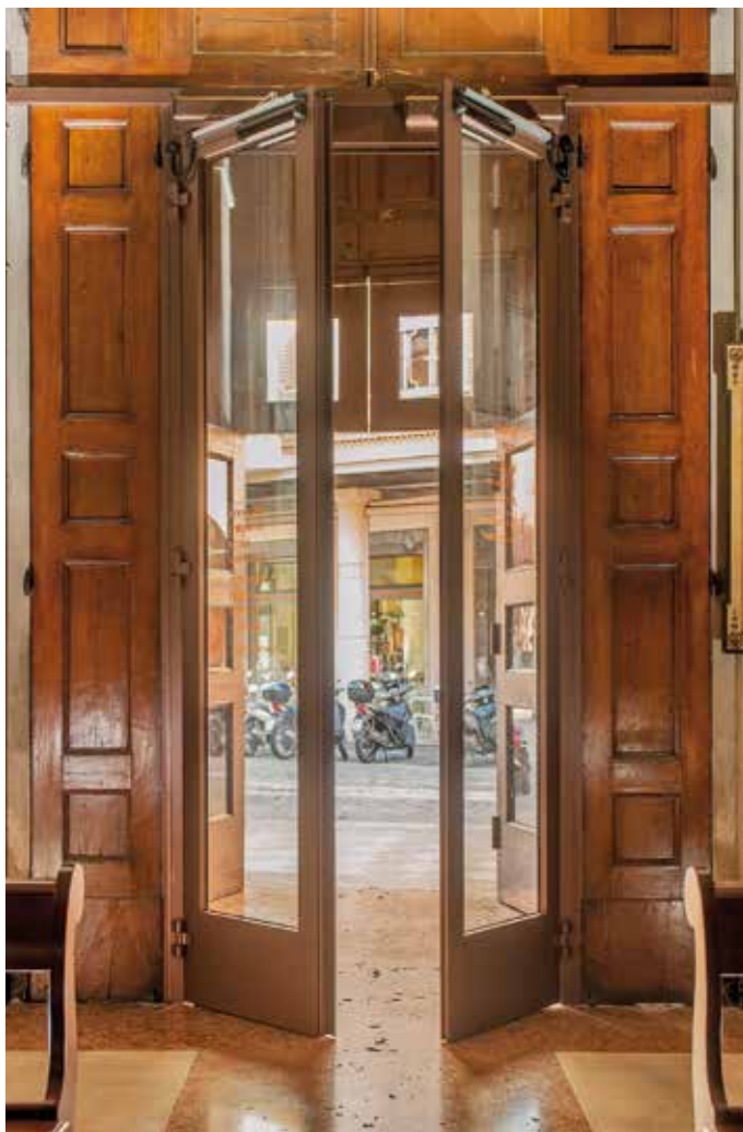
Chiesa di Santa Maria Maddalena di Bologna. Installazione "Mind the door", apertura con il sorriso delle persone