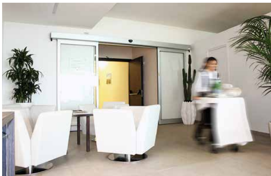
Porte automatiche per interni Ponzi per il transito veloce del personale nella zona sala - cucina

a via di fuga. Le ante tramite la sola pressione manuale, in caso di emergenza, si spalancano ed allineano, lasciando il vano completamente libero ed idoneo ad uscita di sicurezza. La porta automatica oltre ad eliminare le barriere architettoniche, con il dispositivo Ponzi TOS, facilita l'ingresso di materiale ingombrante ed offre la possibilità di aprire il vano in modo integrale. L'ausilio della porta automatica pieghevole Ponzi FTA TOS è indicato in alberghi storici con vani ridotti e privi di spazi laterali o dove vi siano condizioni strutturali dell'edificio, estetiche o di arredamento, che non permettano l'uso delle tradizionali soluzioni scorrevoli. La normativa vigente richiede l'uso di porte automatiche con via di fuga, con apertura a battente delle ante, sotto spinta manuale. Ovviamente, tutto cambia nella progettazione ex novo, dove si possono progettare ingressi di ultimissima generazione, come le porte in solo vetro abilitate a via di fuga, grazie alle automazioni ridondanti Ponzi Rid, che soddisfano i requisiti richiesti dalle normative, oppure le porte girevoli costruite nella soluzione tutto vetro, per esaltare il profilo architettonico ed estetico dell'edificio alberghiero.