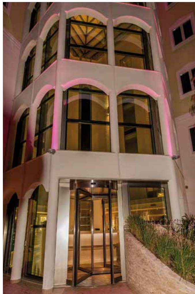
Ingresso hotel contemporaneo: realizzazione Ponzi porta automatica rotante d'ingresso