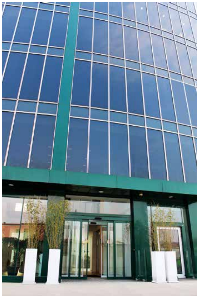
Palazzo della cultura Tecniche Nuove Milano: Realizzazione bussola scorrevole Ponzi per l'ingresso principale

Da sempre finestre e porte, se non di nuova generazione e tecnologia, rappresentano una enorme fonte di dispersione del calore d'inverno ed un entrata di calore d'estate. Un'azienda altamente specializzata come la Ponzi, con le divisioni Ingressi Automatici ed Infissi Metallici, forte della sua esperienza settantennale, svolge un ruolo progettuale sempre più strategico sia per l'albergo di nuova costruzione che per l'albergo tradizionale, che deve ristrutturare l'edificio, compiendo una vera e propria rivoluzione non solo per rendere più funzionale e bella l'entrata, quanto per rinforzarne la funzione di accoglienza e ospitalità. Così pure i serramenti in alluminio e le pareti in vetro di nuova generazione, proposte da Ponzi, hanno un bassissimo indice di trasmittanza, escludono l'effetto serra, danno grande luminosità all'interno degli ambienti ed una perfetta insonorizzazione. Le doppie porte automatiche e quelle girevoli, in maniera particolare, abbattano a loro volta la