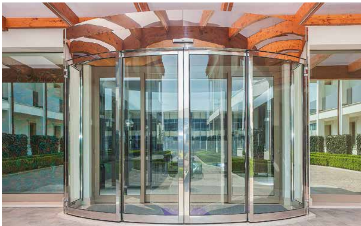
Porta scorrevole curva Ponzi ARCO TOS, omologata per uscita di sicurezza

per grandi vetrate, con ante fino a 200 kg di peso, che scorrono seguendo il gesto della mano con chiusura ermetica del serramento.”