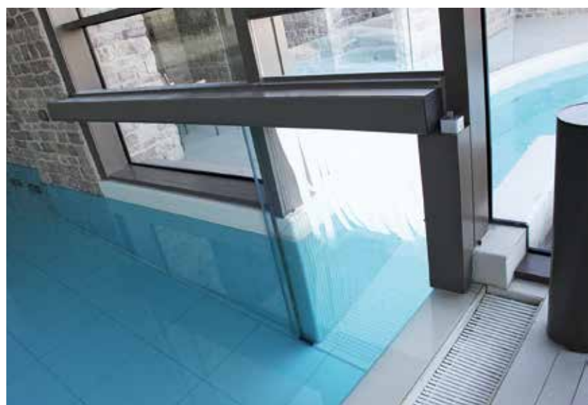
Porta scorrevole Ponzi Water tight per separazione piscina termale interno-esterno, zona SPA