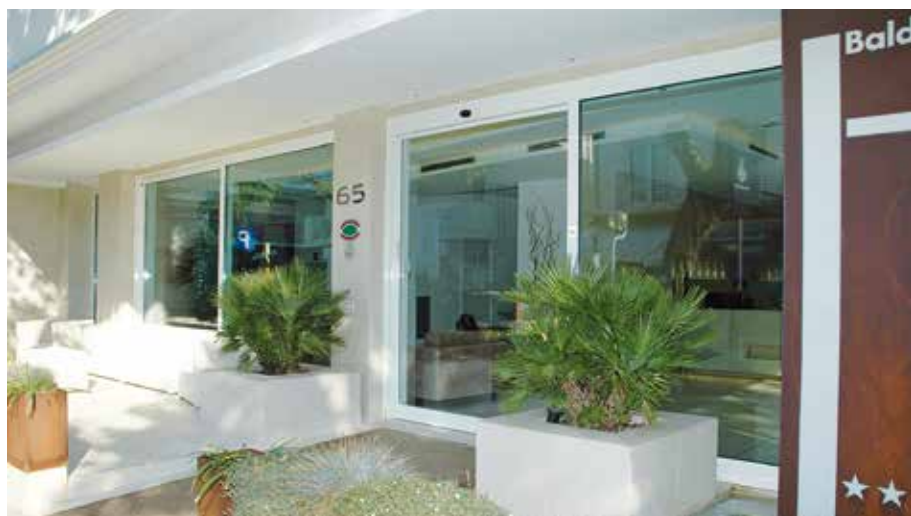
Porta scorrevole Ponzi ad un'anta di grandi dimensioni, idonea per via di fuga e vetrata isolante

Le porte automatiche scorrevoli si prestano per essere applicate in qualsiasi location. Sono disponibili ad una, a due e quattro ante, inoltre in versione telescopica e, ad esse può essere applicato il sistema Ponzi TOS antipanico a sfondamento, per abilitare l'ingresso