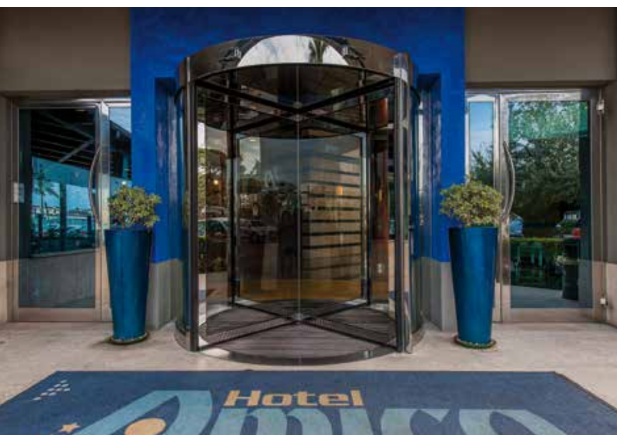
Porta rotante con finitura in acciaio inox lucido a specchio, priva di colonna centrale

Bagnara di Romagna (RA) Tel. 054576009, Fax 045476827 Milano 028394231, Fax 0289422342 Pescara Tel. 0854483020, Fax 0854455895 Roma Tel. 0688566005, Fax 0688560406 www.ponzi-in.it ponzi@ponzi-in.it