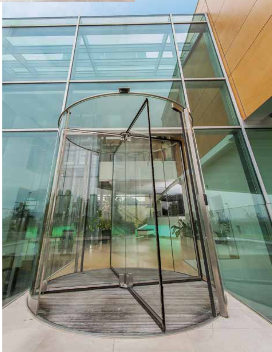
Ingresso di design con porta rotante tutto vetro

La Torre Isozaki, soprannominata Il Dritto, progettata dall'architetto giapponese Arata Isozaki e dall'architetto italiano Andrea Maffei si trova a Milano nell'area ex-Fiera, connessa con la piazza centrale di City Life. Con i suoi 202 m, (207 m l'altezza effettiva dal piano stradale) la torre è uno tra gli edifici più alti d'Italia. Ponzi ha partecipato a questo grande progetto con l'acquisizione degli ingressi rotanti tutto vetro grandi dimensioni, con diametro 3400 mm a tre settori. Questa soluzione garantirà un sicuro comfort termo-acustico in un'area, che delimita l'ingresso di quasi 4000 utenti al giorno. “Si tratta di porte rotanti interamente costruite in vetro, ante, pareti circolari e cappello” spiega Andrea Ponzi. Questa speciale soluzione è senza colonna centrale ed offre una trasparenza assoluta. Gli accessori in acciaio inox permettono alla porta di essere in linea con le ultime tendenze architettoniche, nelle quali il vetro gioca un ruolo di preminenza e permette che la porta si inserisca nei più svariati contesti, diventando un oggetto di design.