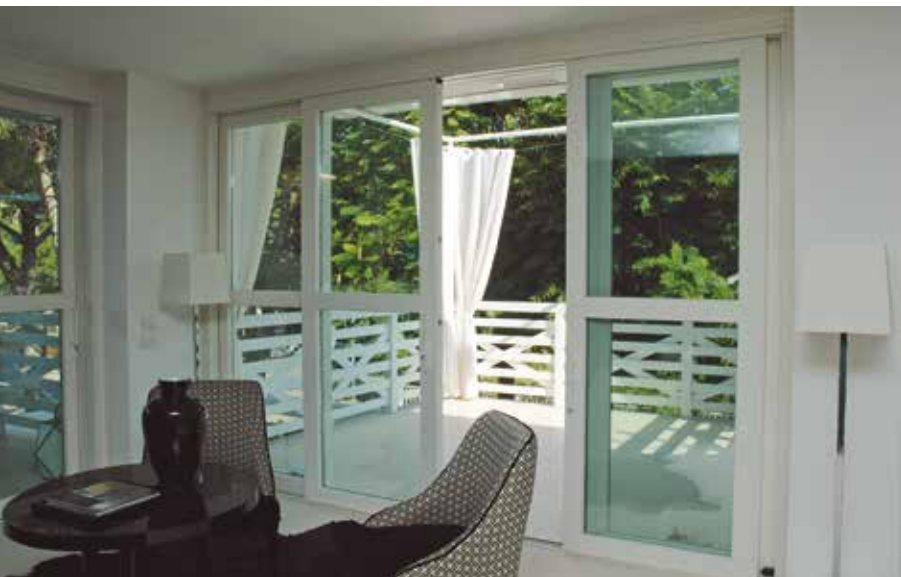
Infissi scorrevoli esterni Ponzi "Alza e Scorri" in movimento, ad alta tenuta termo-acustica per ambienti di design