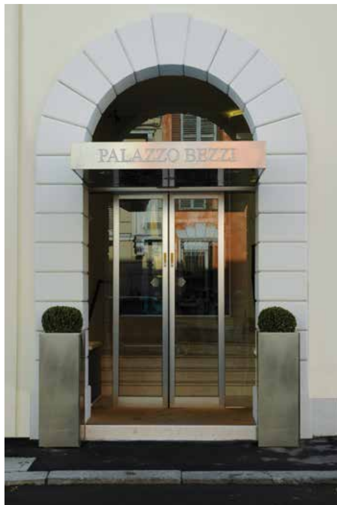
Hotel storico con ingresso ridondante RID antipanico, completo di profilati termo-isolanti Ponzi

Un'altra novità di Ponzi Ingressi Automatici è la porta automatica ridondante RID. Le porte automatiche scorrevoli “ridondanti” Ponzi affidano la sicurezza all'automatismo, in modo che l'apertura delle ante in caso di pericolo sia assicurata. Le ante mobili si aprono grazie alle due automazioni, una per anta, liberando così il normale vano di passaggio e permettendo la fuga delle persone, attraverso l'impulso dei rilevatori di movimento, di fumo e fuoco. Le porte automatiche “Ridondanti” trovano gli stessi campi di applicazione delle porte scorrevoli dotate di dispositivo antipanico TOS, come uffici, ristoranti ed hotel, negozi e grande distribuzione, aeroporti ed ospedali e vi è il loro utilizzo, qualora esistano vincoli architettonici, di arredamento, di passaggio di persone, che non consentano l'apertura a battente delle ante. Il sistema ridondante è chiamato a doppia tecnologia per l'utilizzo di una serie di componenti obbligatori, necessari per il controllo e la verifica della sicurezza durante l'emergenza in antipanico. È disponibile per tipologie di automazioni lineari scorrevoli, telescopiche e curve. Si abbina facilmente a tutti i profilati Ponzi. Di particolare interesse è l'utilizzo con ante di solo vetro oppure con gli innovativi profilati Ponzi brevettati a taglio termico, ad alto isolamento