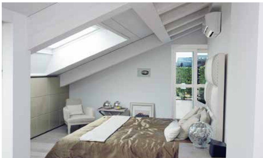
Serramenti esterni Hi-Tech Ponzi ad alto isolamento termico, per camere ed ambienti comuni di alberghi.