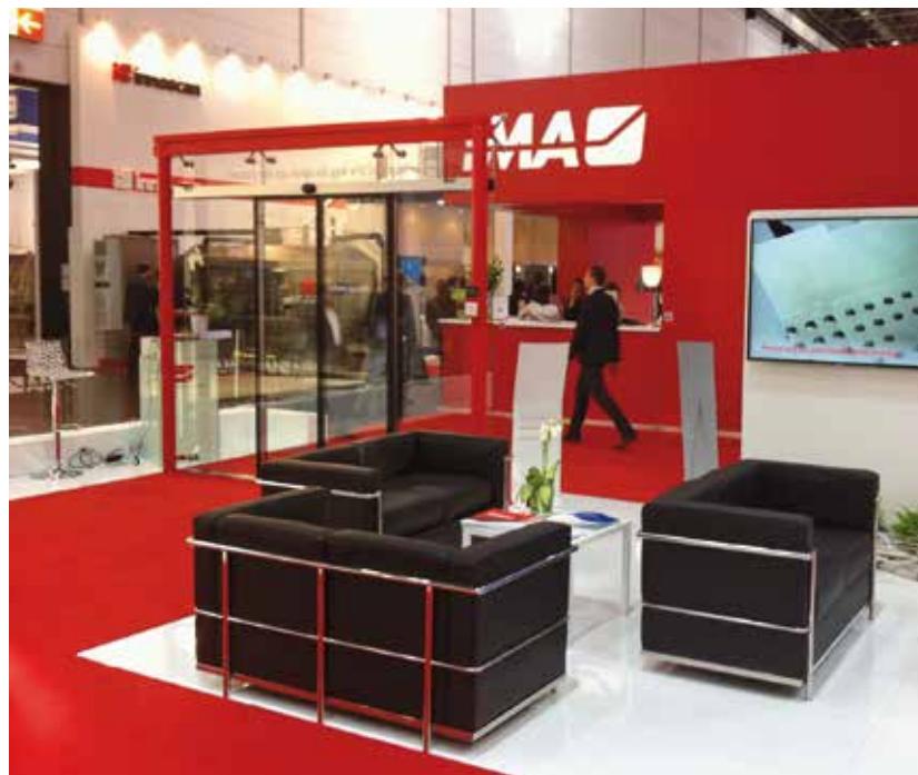
Porta del Sorriso Ponzi presso lo stand IMA Interpack 2014 a Dusseldorf

termico e acustico. Come accennato, le porte Ponzi RID sono ideali per risolvere il problema dell'installazione di una porta automatica in situazioni estreme, come nei centri storici, dove non è possibile installare le porte automatiche più convenzionali, con la via di fuga con ante apribili a battente. È un prodotto, che accoppiato al profilato a taglio Termico offre un elevato livello di insonorizzazione (oltre i 40 decibel), un bassissimo indice di trasmittanza e garantisce il massimo isolamento termico secondo i protocolli diffusi nel settore. Il serramento è dotato di vetrocamera, con gas neutro argon all'interno.