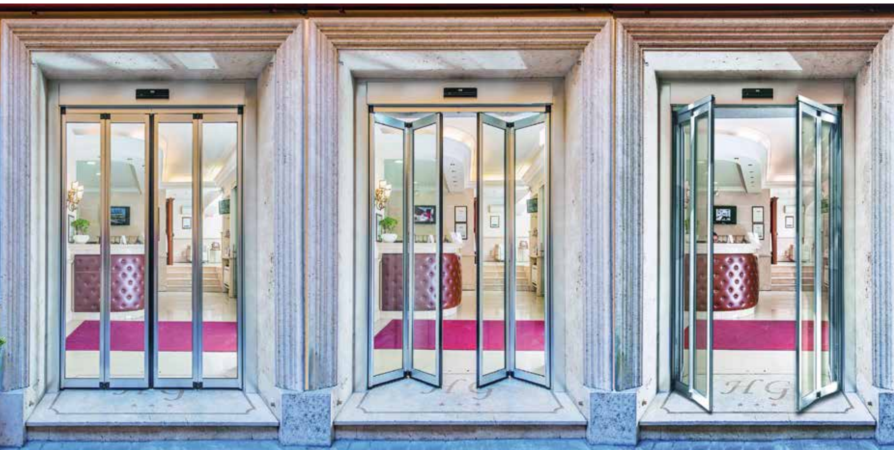
Porta pieghevole Ponzi FTA situata in palazzo d'epoca in centro storico, con certificato di idoneità per via di fuga