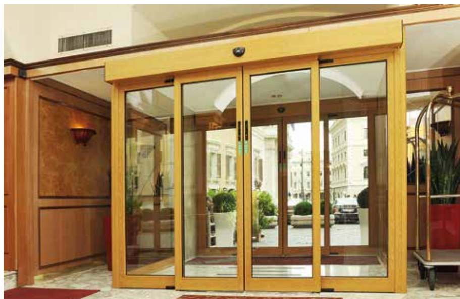
Bussola scorrevole Ponzi in legno, realizzata per la ristrutturazione di un hotel in edificio storico