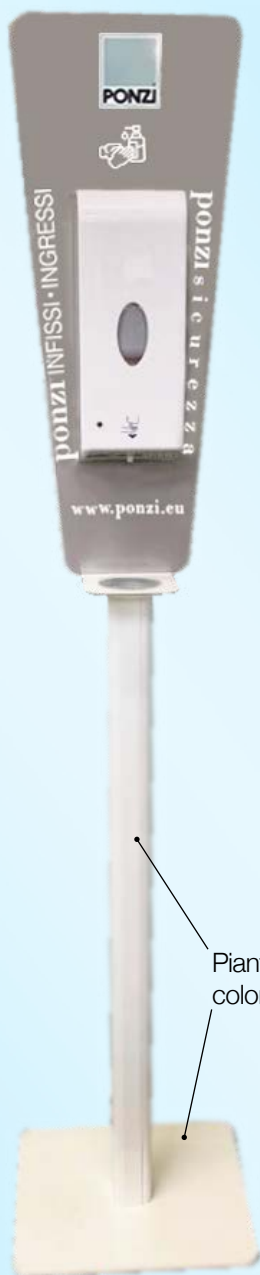
Piantana e colonnina color BIANCO

Dispositivo di igiene e sicurezza per luoghi pubblici e privati