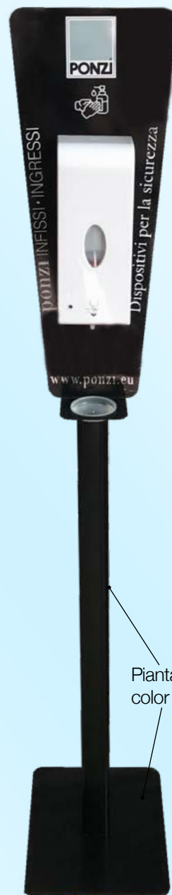
Piantana e colonnina color NERO