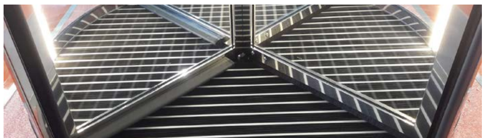
Ponzi Vitrum Frame - motore ad incasso con zerbino tecnico Ponzi Scrub a copertura del motore a pavimento