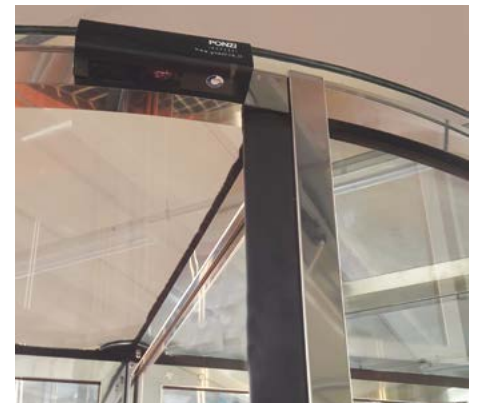
Sensore di sicurezza e bordi sensibili verticali