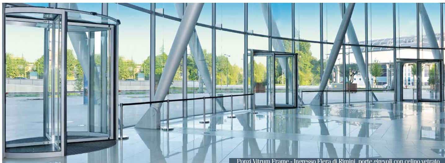
Ponzi Vitrum Frame - Ingresso Fiera di Rimini, porte girevoli con celino vetrato