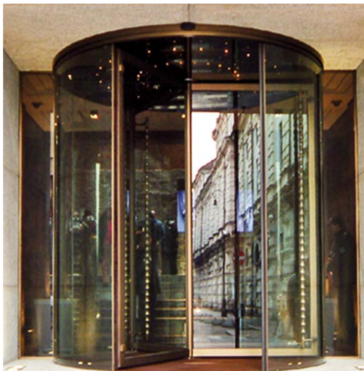
Ponzi Vitrum - Ingresso con celino vetrato illuminato con luci led