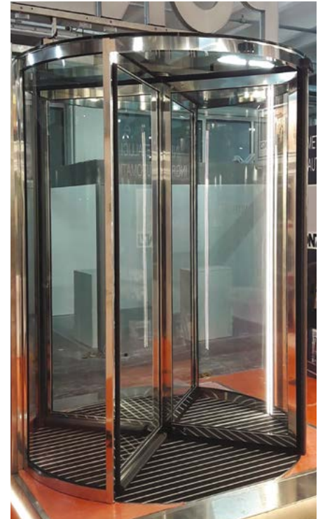
Ponzi Vitrum Frame - tetto in vetro

Per la porta girevole Ponzi Vitrum Frame sono disponibili diverse possibilità di realizzazioni quali: maniglioni tubolari orizzontali o verticali in acciaio inox satinato per le versioni manuali; chiusura notturna, sistema "Night Sliding Door", composta da due ante vetrate curve, dotate di serratura e cilindro, che scorrono solo manualmente su apposita guida tubolare, in acciaio inox, (durante l'apertura vengono sovrapposte alle ante curve fisse, mentre negli orari di chiusura vengono riposte in posizione centrale, conferendo alla porta, un aspetto cilindrico). E' anche disponibile un ulteriore sistema di bloccaggio elettromagnetico della rotazione, mediante dispositivo con comando che può essere posizionato a distanza (ad esempio nella reception). La porta è realizzata nella versione standard con serratura speciale completa di eurocilindro. I vetri possono essere di diverse colorazioni: standard trasparente, extrachiaro o con apposite colorazioni quali verde e grigio. A copertura della scatola motore, murata a pavimento, solitamente viene fornito anche uno zerbino tecnico Ponzi ad incasso, con spessore variabile da mm 15 fino a mm 25, in varie colorazioni (prevalentemente in gomma nera o con apposite mescole di colorazione grigio antracite). Per facilitare l'inserimento dello zerbino nel pavimento viene fornito un apposito anello in acciaio inox da premurare.