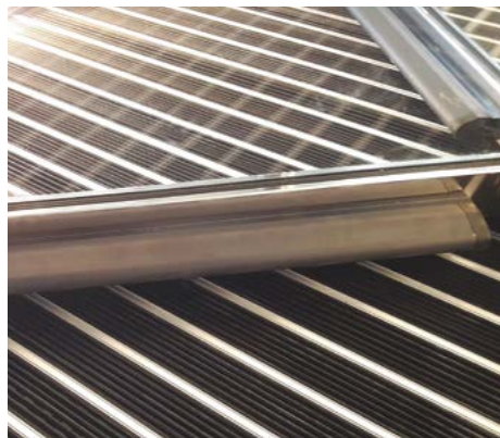
Sicurezza battitacco nello zoccolo inferiore