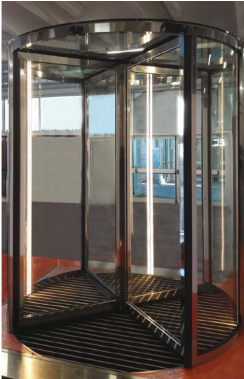
Ponzi Vitrum Frame - porta girevole automatica