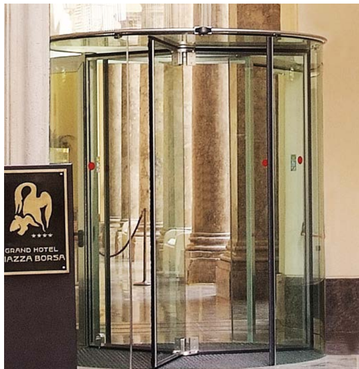
Ponzi Vitrum - Grand Hotel, edificio storico vincolato di Palermo