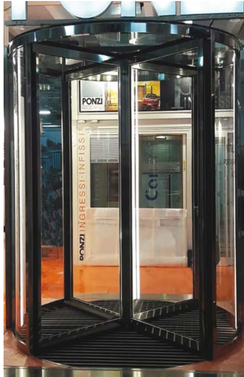
Ponzi Vitrum Frame - soluzione con pareti curve trasparenti