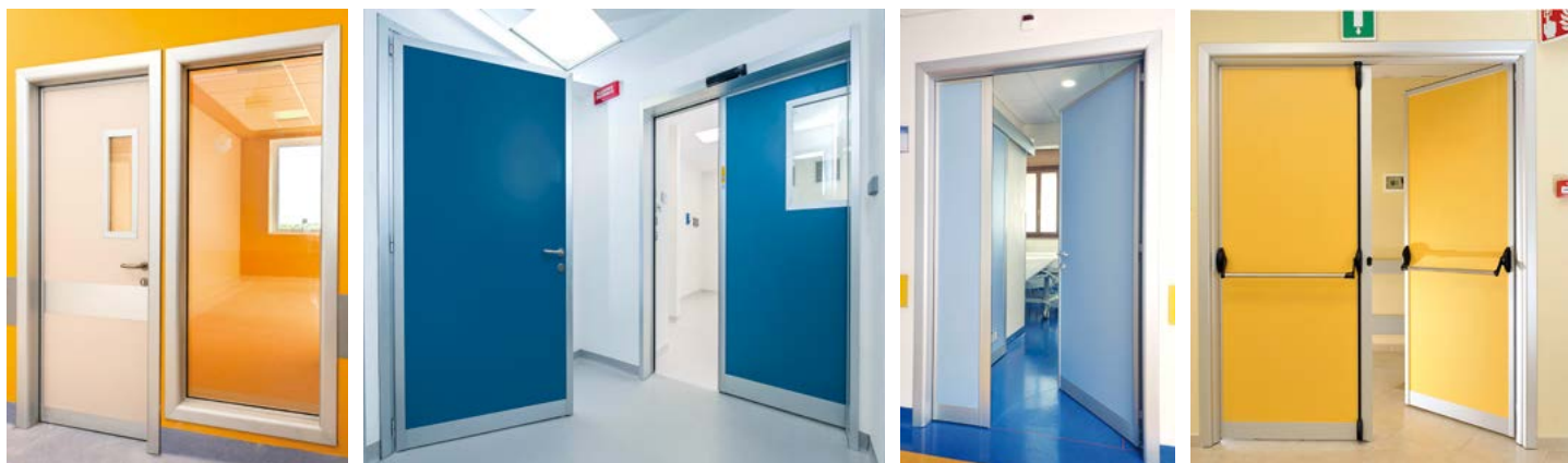
ALU con visiva fissa ambulatori ALU a battente e scorrevole con opzione automatica ALU degenza ospedaliera ALU a doppio battente maniglione U.S.