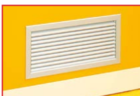
Griglia - lamelle di aerazione

L'anta in versione PANEL anti-RX viene realizzata con pannello tamburato di spessore 45 mm, con inserita una lastra in lamina di piombo di 1 o 2 mm, a seconda delle diverse necessità di schermatura e rivestita all'esterno con laminato plastico, di altezza 0,9 mm Classe 1. L'imbotte è resistente ai raggi X, grazie all'inserimento di schermature in lastre di piombo primario, negli spessori di 1 o 2 mm.