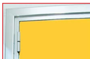
LAMINATI - mazzetta Colori

Gli imbotti perimetrali ed i telai sono realizzati con finiture in elettrocolore anodizzato silver ARS1 verniciato RAL o con brillantatura tipo INOX. Il pannello della porta può essere in laminato colorato, simil legno o acciaio INOX.