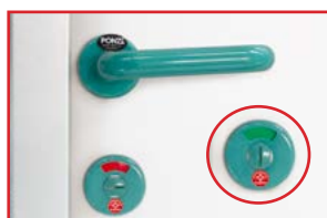
Maniglia antibatterica resina