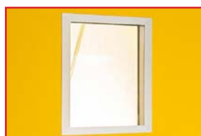
Visiva standard con telaio

La porta ALU può essere fornita con vari optional quali visiva di diverse dimensioni e forme, doppio vetro con tendina a veneziana per l'oscuramento totale e griglia di areazione in alluminio o PVC.