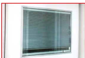
Visiva con tenda oscurante