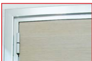
LAMINATI - finitura Simil Legno