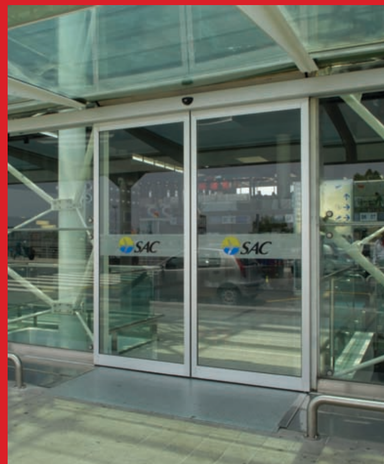
Ponzi TOS: porta scorrevole automatica lineare