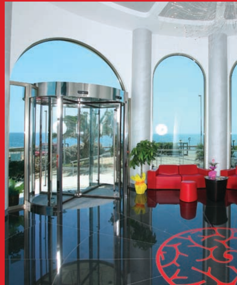
Porta automatica girevole Ponzi TQ finitura acciaio inox

Di design raffinato ed essenziale, l'automazione Ponzi Brio lascia inalterato il telaio della porta, grazie ad un operatore sottile ad ingombro ridotto, posizionato nel montante perpendicolare dell'ingresso. Ha una struttura tubolare verticale, a misura unica, integrabile nella battuta di chiusura a ridottissimo ingombro. Adatto a porte di compartimentazione interna, movimentata un'anta del peso massimo di 50 kg e può essere utilizzato su porte scorrevoli già esistenti. Ponzi Ingressi Automatici per questo tipo di automazione, completamente innovativa nel suo genere, ha depositato domanda di brevetto.