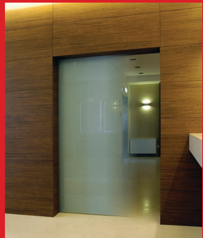
Ponzi Brio: automazione verticale