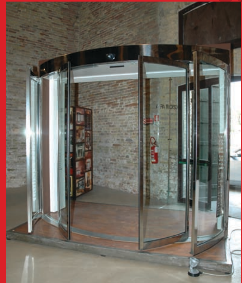
Porta automatica scorrevole curva Arco Ribassato Tos